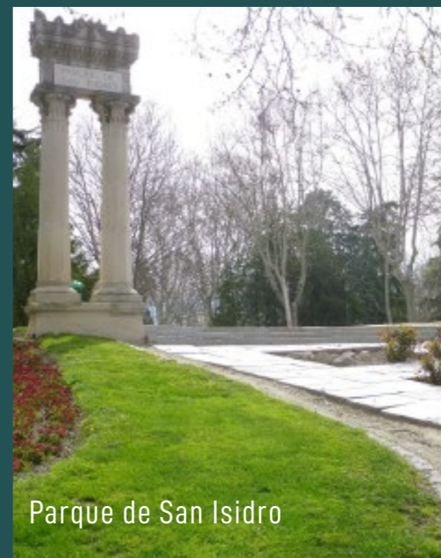
Parque de San Isidro