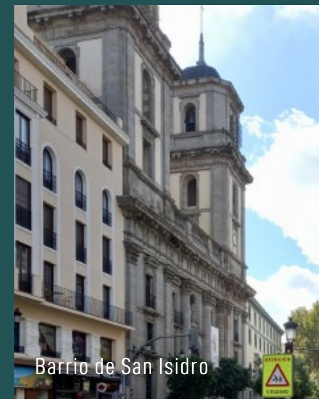
Barrio de San Isidro